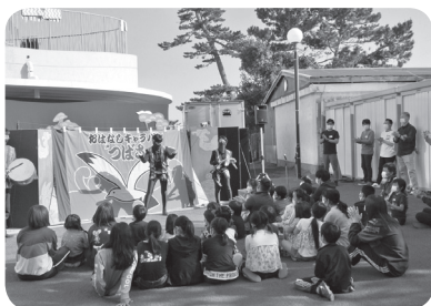
屋外での公演は、子どもたちの気分転換にもなったようです

YouTube配信やDVDの配布など、劇団にも様々な対応を模索していただいておりますが、劇中のミニゲームに楽しそうに参加される子どもたちの姿を見て、「生の舞台」をお届けすることの意義を改めて感じました。