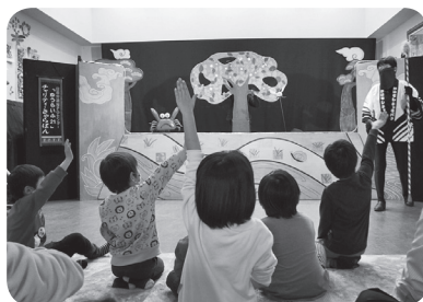
ミニゲームにも積極的に手を挙げて参加していただきました