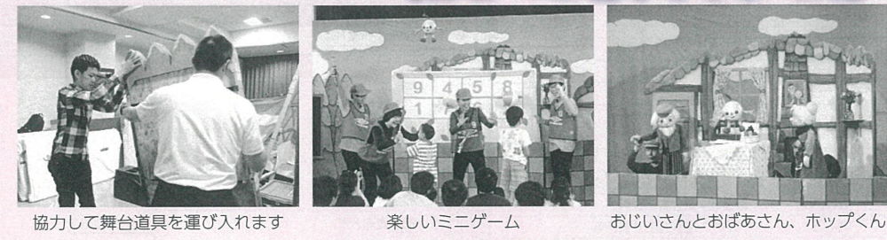
協力して舞台道具を運び入れます 楽しいミニゲーム おじいさんとおばあさん、ホップくん