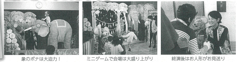
象のボナは大迫力! ミニゲームで会場は大盛り上がり 終演後はお人形がお見送り