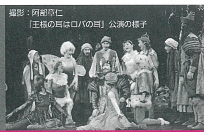
撮影: 阿部幸仁 「王様の耳はロバの耳」公演の様子

「クリスマスチャリティー公演」「チャリティーきゃらばん」は組合員のみなさんから毎月100円ずついただいている「福祉基金」からの寄付金で公演を行なっています。また、エルダークラブ会員、リック会員の有志のみなさん、「ゆうらいふ21」の会員企業・団体・個人のみなさんにもご協力をいただいています。みなさんからいただいた100円がどのようなことに使われているのか見てみませんか。